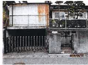
宅盤は道路より約1.7m高