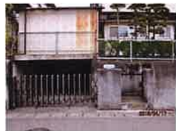
宅盤は道路より約1.7m高