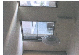
ロフトから見る居室・窓