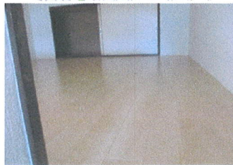
ロフト床部分・収納付