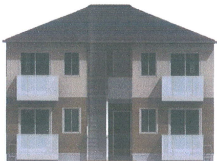
※完成イメージです。